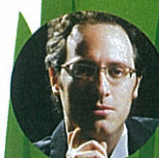
Chen Halevi 哈勒維 clarinet 單簧管 (Israel 以色列)