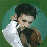
Nils Mönkemeyer 孟克梅耶 viola 中提琴 (Germany 德國)