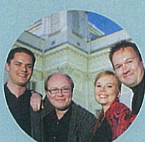
New Helsinki Quartet (Finland) Acclaimed for possessing both passion and spirit, as well as a sense of style and a superior technique 新赫爾辛基四重奏 (芬蘭) 演奏兼備熱情與氣魄，風格獨特，技藝超凡 string quartet 弦樂四重奏