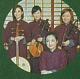
Members of the Hong Kong Chinese Orchestra 香港中樂團成員