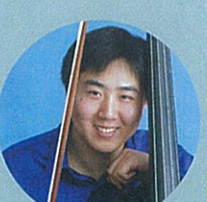
Da Xun Zhang (China) Says the Washington Post "the double bass can have no better champion than Zhang" 張達尋 (中國) 美國華盛頓郵報：「張達尋可在低音大提琴的領域上稱王」 double bass 低音大提琴