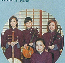
Members of the Hong Kong Chinese Orchestra Says the New York Times "it was as fascinating to see the orchestra as it was to hear it" 香港中樂團成員 紐約時報：「這個樂團，眼與耳聞同樣精彩」