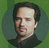
Peter Jablonski 傑布隆斯基 piano 鋼琴 (Sweden 瑞典)