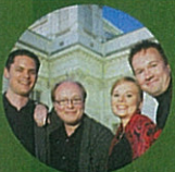
New Helsinki Quartet 新赫爾辛基四重奏 string quartet 弦樂四重奏 (Finland 芬蘭)