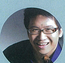
Dan Zhu (China) Hailed as "one of the emerging Chinese international artists today" by Gramophone Magazine 朱丹 (中國) 英國留聲機雜誌：「當今冒起的世界級華人小提琴家之一」 violin 小提琴